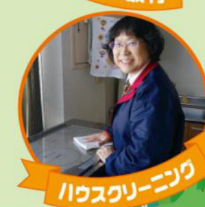
ハウスクリーニング